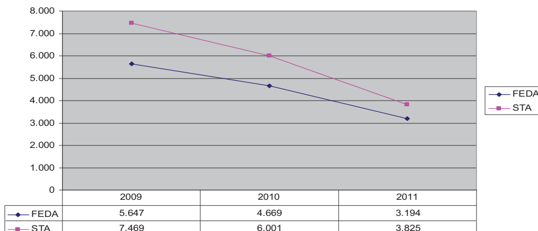
Evolució cànon 2009 - 2011

A continuació es mostra l'evolució de la recaptació en concepte de cànon pel consum d'electricitat i telèfon des de l'any 2009 fins a aquest any 2011.