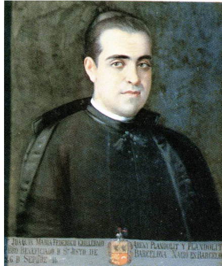
Figura 3 a . Retrat de Joaquim d'Areny-Plandolit