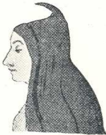
Kvinnodräkt i Ordino.

Habitualment les dones andorranes es cobrien el cap amb un mocador blanc que es lligaven a sota de la barbeta. Arreu del Pirineu, segons Ramon Violant i Simorra, hi havia diferents tipus de lligadures. L'etnòleg pallarès també ens il·lustra sobre "la caputxa que servia d'abrigall, de mantell de dol i de mantellina per assistir al temple." Les paraules i la imatge de Mörner ens descriuen, doncs, una caputxa.