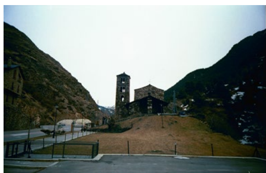
Església de Sant Joan de Caselles. E. Dilmé i J. Reguant

D'altra banda, cal fer esment del fet que s'ha dut a terme l'entorn de protecció de l'Hotel Rosaleda –declarat monument pel Decret del Govern de l'11 de febrer del 2004–, aprovat pel Decret del Govern del 2 de febrer del 2005.