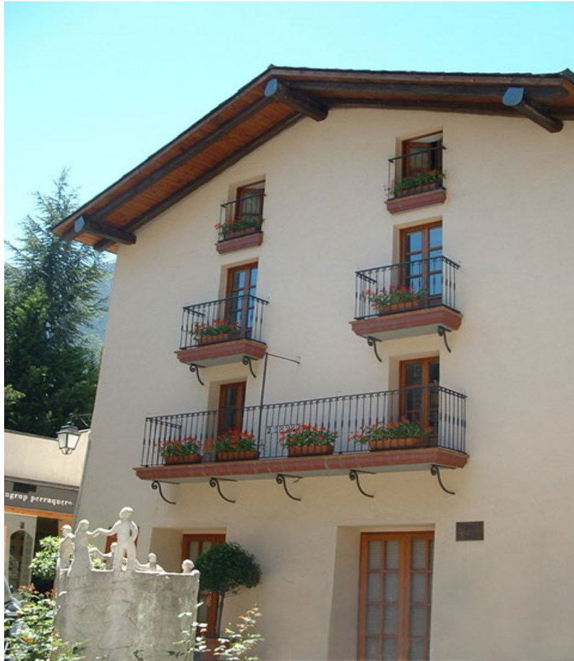
Casa Bauró, Andorra la Vella. Seu de la Biblioteca Nacional. BN.

La regulació dels museus es basa, principalment, en la determinació del concepte de museu, que s'ha inspirat en les definicions establertes per l'ICOM, entitat internacional de museus dependent de la UNESCO, del qual Andorra és membre actiu des del 1984. Aquesta tasca s'ha posposat per al 2006.