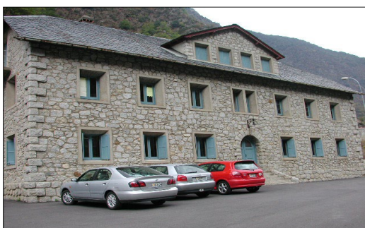
Casa dels empleats de FHASA, Encamp, PCA.

Edificis industrials: la central de FHASA (Encamp), casa dels empleats de FHASA (Encamp), la central auxiliar de FHASA (Encamp), el mur de la carretera de FHASA (Encamp), la presa d'Engolasters, la presa de Ràmio i la caseta del guarda (Escaldes-Engordany), la terminal del funicular d'Engolasters i la casa del guarda (Escaldes-Engordany), l'edifici de Ràdio Andorra (Encamp), el garatge i cinema Valira (antic Col·legi Meritxell, Escaldes-Engordany) i l'antiga fàbrica de les pells (Escaldes-Engordany).