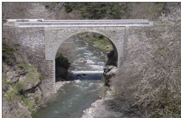
Pont d'Anyós, la Massana. PCA.

Ponts: el pont de FHASA (Encamp), el pont de Sassanat (Escaldes-Engordany), el pont nou de la Margineda (Sant Julià de Lòria) i el pont d'Anyós (La Massana).