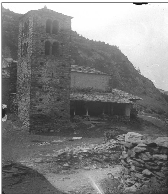
Església de Sant Joan de Caselles, Canillo.

La Llei del patrimoni cultural d'Andorra dona els mecanismes i les garanties suficients perquè el patrimoni, en el sentit que constitueix un dels testimonis principals de la història, la identitat i la creativitat d'un país, pugui ésser salvaguardat, tant per les obligacions que adquireixen les administracions (Govern i comuns) com pels instruments amb els quals es doten aquestes institucions per desenvolupar la tasca que els és encomanada. Permet desenvolupar l'obligació constitucional en la conservació del patrimoni cultural. El seu objecte és la protecció, la conservació i restauració, la conservació integrada, el coneixement, el foment i la difusió del patrimoni cultural d'Andorra.