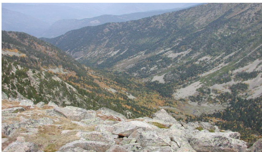
Vall del Madriu-Perafita-Claror. PCA

També inclou la fitxa general del conjunt de la vall. La major part d'aquestes fitxes constitueixen un extracte de l'inventari de la vall elaborat des d'ICOMOS per encàrrec del ministeri titular de la cultura, que és el resultat de les campanyes de prospecció efectuades els anys 2003 i 2004, i que ha estat presentat a la UNESCO el mes de gener del 2005.