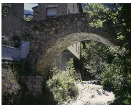
Pont de la Tosca, Escaldes-Engordany, E. Dilmé i J. Reguant.