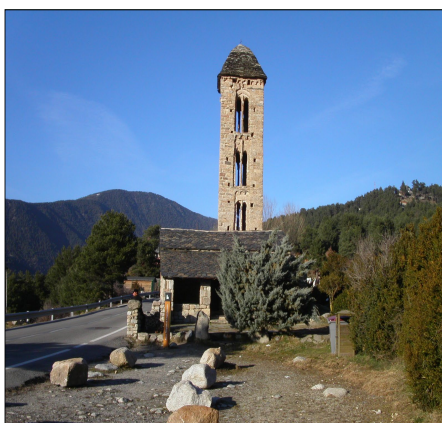
Església de Sant Miquel d'Engolasters, Escaldes-Engordany. PCA.