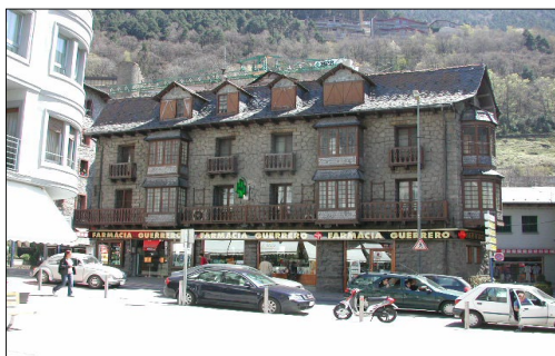
Casa Lacruz, Escaldes-Engordany, PCA.