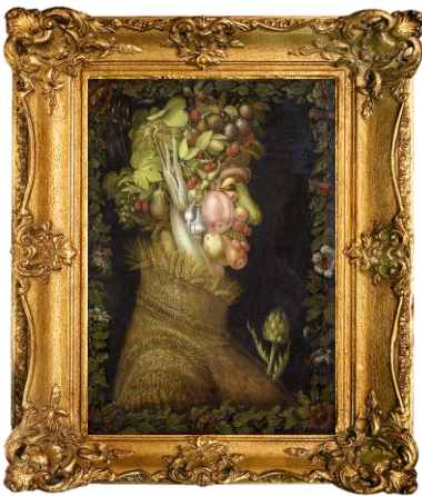
Giuseppe Arcimboldo, L'Été