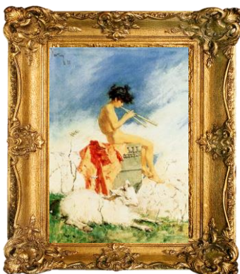
Marià Fortuny, Idile