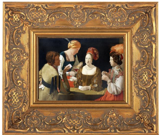
Georges de La Tour, Le Tricheur à l'as de carreau