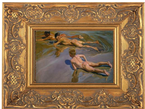
Joaquim Sorolla, Enfants sur la plage