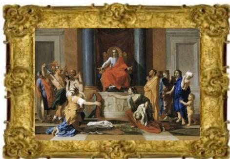
Nicolas Poussin, Le Jugement de Salomon