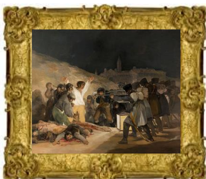
Francisco de Goya, El tres de mayo