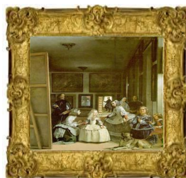
Diego Velázquez, Les Menines