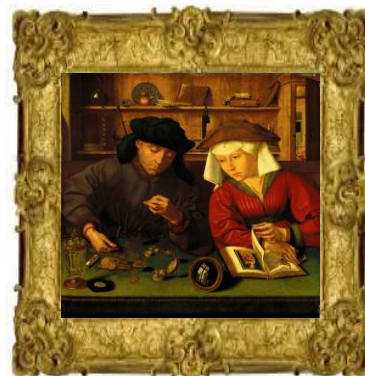
Quentin Metsys, Le Prêteur et sa femme